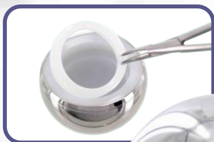
MOONSTONE with locking ring à bague