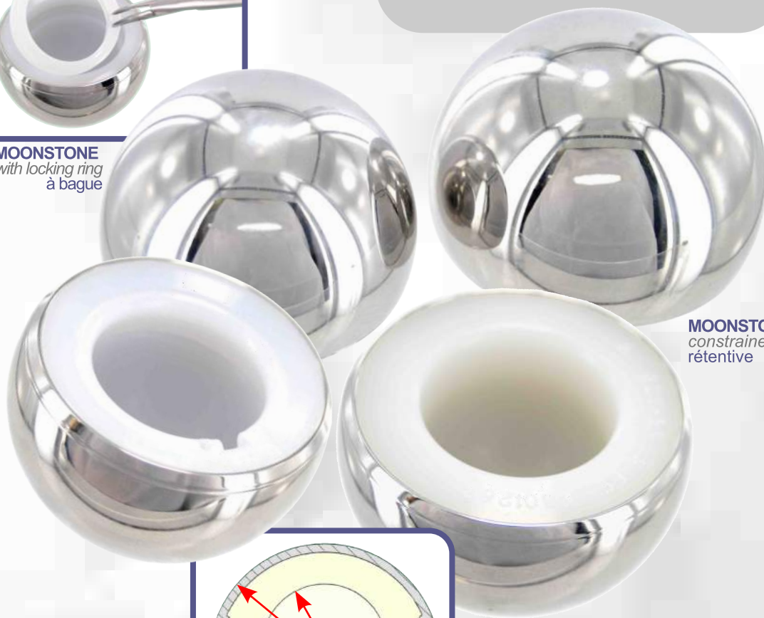
MOONSTONE constrained rétentive